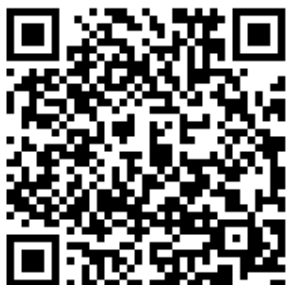
Барбоскины в супермаркете